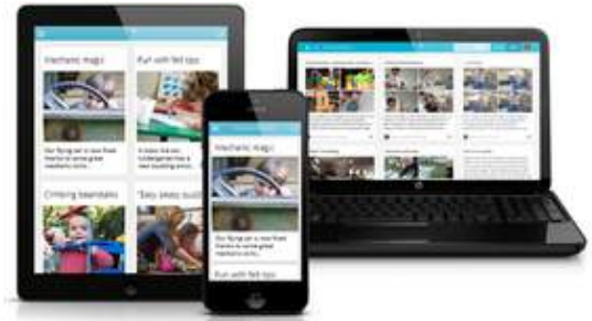
「ストーリーパーク」イメージ2