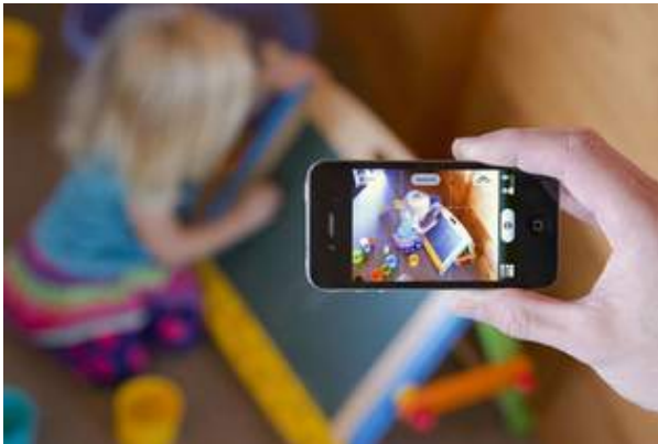
「ストーリーパーク」イメージ3