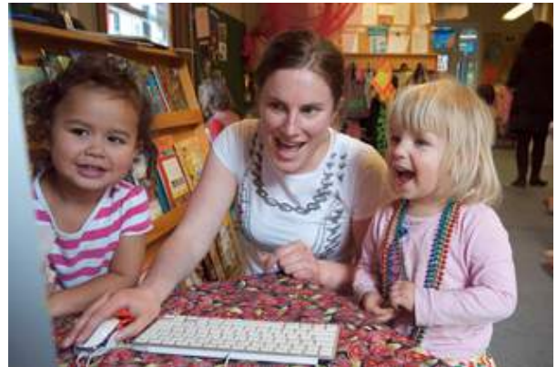
「ストーリーパーク」イメージ4