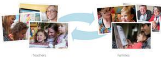
「ストーリーパーク」イメージ1